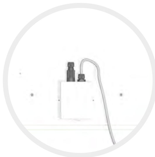
Plug-and-play box aan de achterzijde