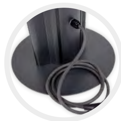
Sokkel met stekkerkabel

TIP VAN ETHERMA: SOLAMAGIC® reservelampen vindt u op pagina 45.