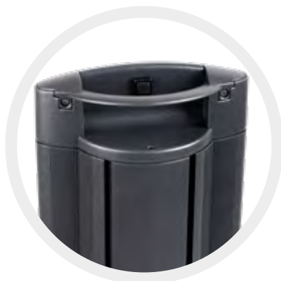
Aan/uit-knop aan de achterzijde