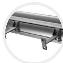
Achterzijde S3 T-bevestiging