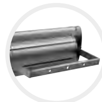
Achterzijde S1+ beugel